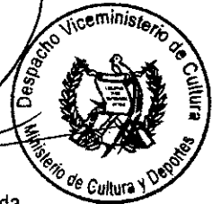
Lic. Leonel Estuardo Reyes Estrada Viceministro de Cultura Ministerio de Cultura y Deportes